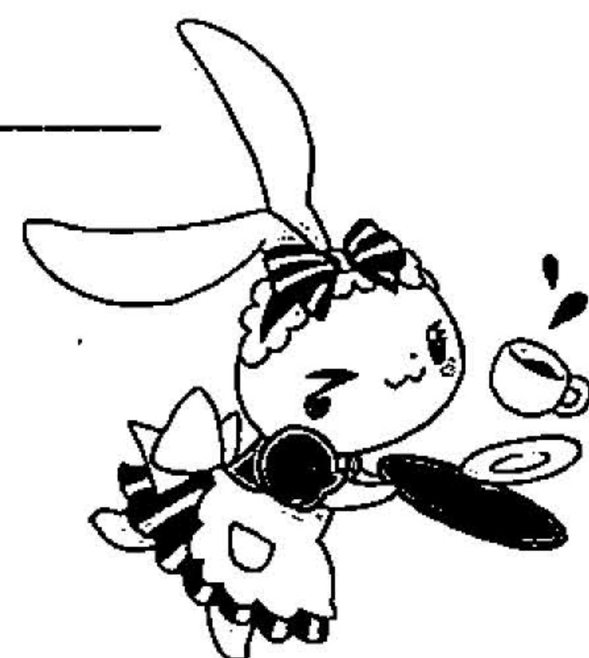
YELL マスコットキャラ 「えるぼん」