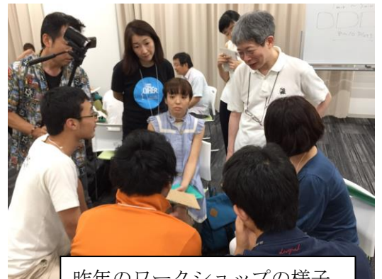
昨年のワークショップの様子